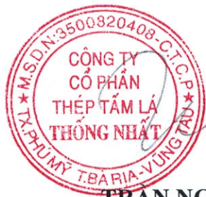
TRẦN NGỌC TUẤN